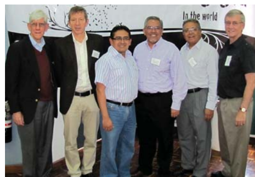
Grupo representante de países hispanos da A.L.