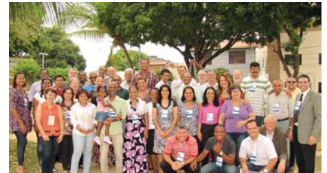
Salvador (BA): 2,3/Nov/12, na UniCristã – Fac. Cristã da Bahia. Tema: “O Desenvolvimento da Educação Teológica para a Excelência no Ministério”.