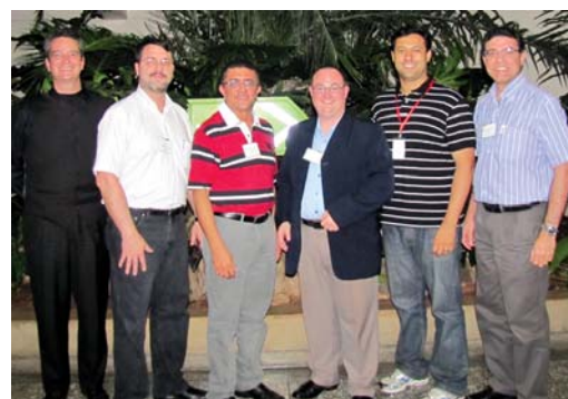
Grupo representante do Brasil.