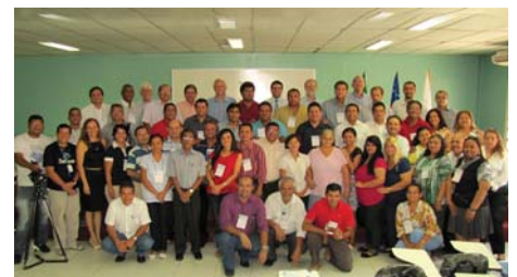
Manaus (AM): 9,10/Nov/12, no IBADAM – Instituto Bib. da A. de Deus do Amazonas. Tema: “O Desenv. da Educ. Teol. para a Excelência no Ministério”.