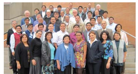
Lima (Peru): 19-22/Nov/12, no SEL – Seminario Evangélico de Lima. Tema: “O Desenvolvimento Institucional”.