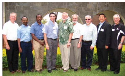
Presidentes das associações continentais do ICETE.