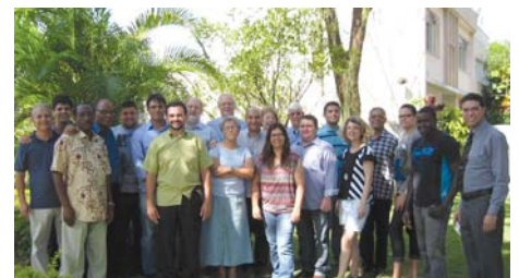
Niterói (RJ): 5-7/Nov/12, no STEP – Seminário Teol. Escola de Pastores. Tema: “O Desenv. de Currículo para a Excelência na Educação Teológica”.