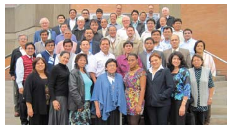
Lima (Peru): 19-22/Nov/12, en SEL – Seminario Evangélico de Lima. Tema: “El Desarrollo Educativo”.