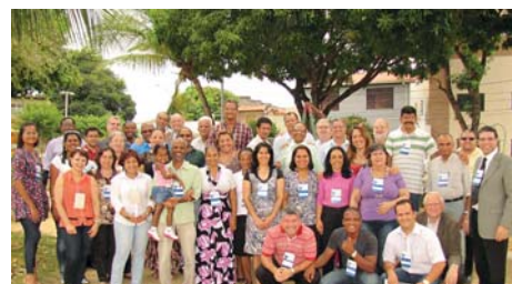
Salvador (BA): 2,3/Nov/12, en UniCristã – Fac. Cristiana de Bahia. Tema: “El Desarrollo de la Educación Teológica para la Excelencia en lo Ministerio”.