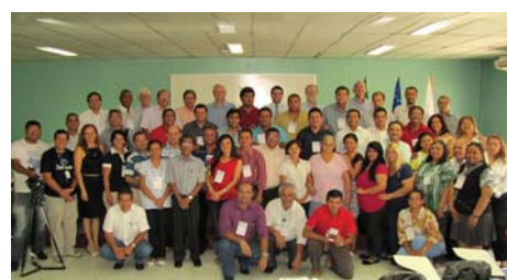
Manaus (AM): 9,10/Nov/12, en IBADAM – Instituto Bib. da A. de Dios de Amazonas. Tema: “El Des. de la Educ. Teol. p/ la Excelencia en lo Ministerio”.