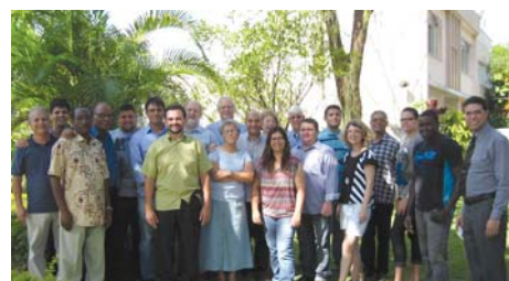
Niterói (RJ): 5-7/Nov/12, en STEP – Seminario Teol. Escuela de Pastores. Tema: “El Desarrollo de lo Currículum p la Excelencia en la Educ. Teológica.”