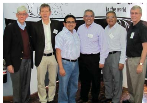
Grupo representante de países hispanos de A.L.