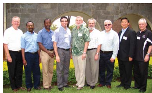
Presidentes de las asociaciones continentales de ICETE.